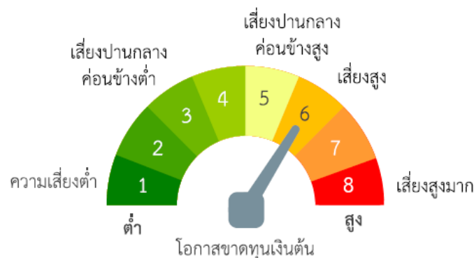
แผนภาพแสดงตำแหน่งความเสี่ยงของกองทุนรวม

ลักษณะความเสี่ยง และแนวทางการบริหารความเสี่ยงของกองทุน โดยเรียงลำดับตามโอกาสที่อาจเกิดขึ้นและนัยสำคัญของผลกระทบ จากมากไปหาน้อย ซึ่งสามารถสรุปได้ดังต่อไปนี้