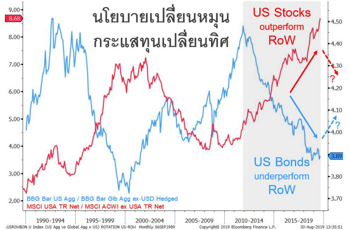
US vs. Rest-of-World : multi-year divergence reaches a tipping point

แนวโน้มการเปลี่ยนแปลงของนโยบายการเงินและการคลังในสหรัฐฯ “เปรียบเทียบกับประเทศอื่นๆ” น่าจะเปลี่ยนแนวโน้มผลตอบแทนจากการลงทุนในตลาดสหรัฐฯ “เมื่อเทียบกับตลาดอื่นๆ” เช่นกัน ในช่วงปีข้างหน้า หุ้นสหรัฐฯ น่าจะ outperform ขณะที่ บอนด์สหรัฐฯ น่าจะ underperform คะแนนนิยม ทรัมป์ ตกต่ำลงในทุกรัฐที่แข่งขันกันดุเดือด